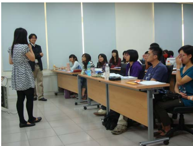
↑ 市立大里高中實習生經驗分享