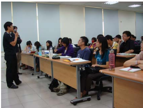
↑ 明道中學實習生經驗分享