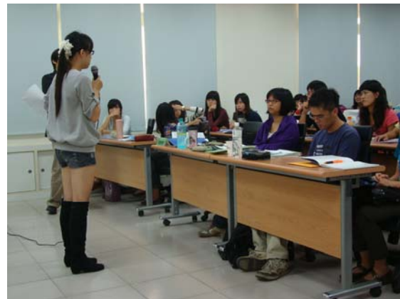
↑ 東山高中實習生經驗分享