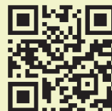
掃描此QR code 至教育經營與管理學系系網