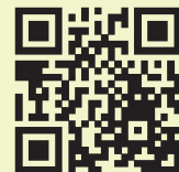
掃描此QR code 至網頁表單報名