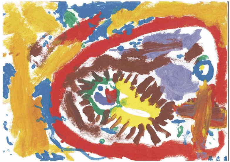
幼兒姓名：陳禹霏 年齡：4歲4個月 學校：基隆深澳國小附幼