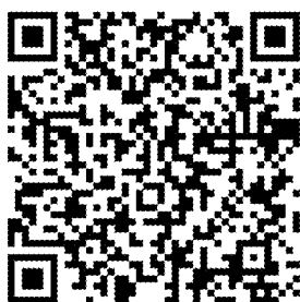
攜手桃花源 Youtube 頻道