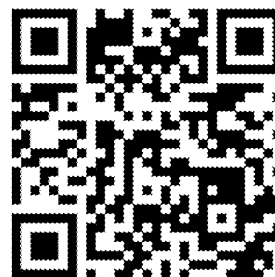
課程與教學計畫填報系統